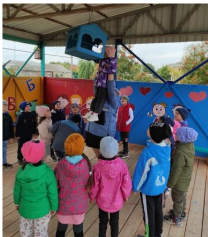
Покормили птиц на участке

В течение всей недели велась работа по формированию нравственных качеств у дошколят и мотивированию детей на совершение добрых поступков и добрых дел.