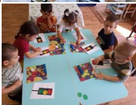
Весело и познавательно прошли спортивные досуги «Страна правил дорожного движения», «В гостях у Светофора».