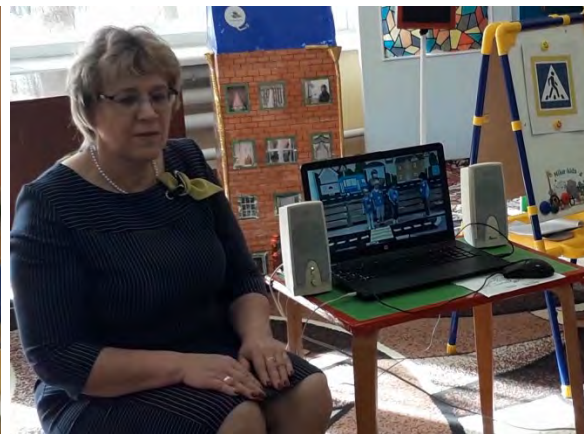
- Воспитанники участвовали в конкурсах по ПДД