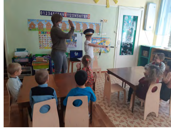
- Тематические и обучающие занятия «Дорожные знаки», «Твой друг Светофор», «Мы маленькие участники дорожного движения», «Помни правила дорожного движения» и т.д.