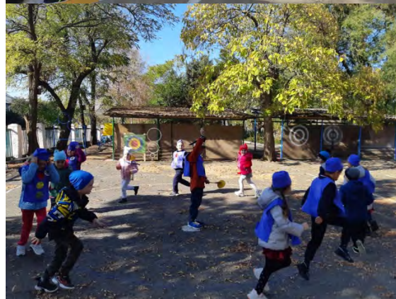
- Проект «Безопасный пешеход начинается с детства». Цель: Создание условий для усвоения и закрепления детьми навыков безопасного поведения в окружающей дорожно-транспортной среде.