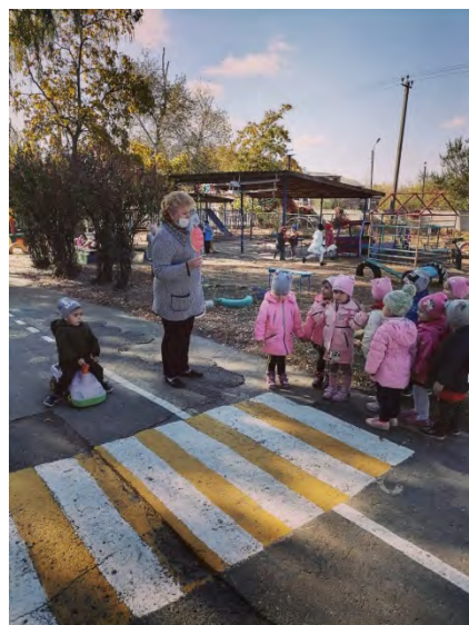
- Квест-игра «Дорога безопасности»