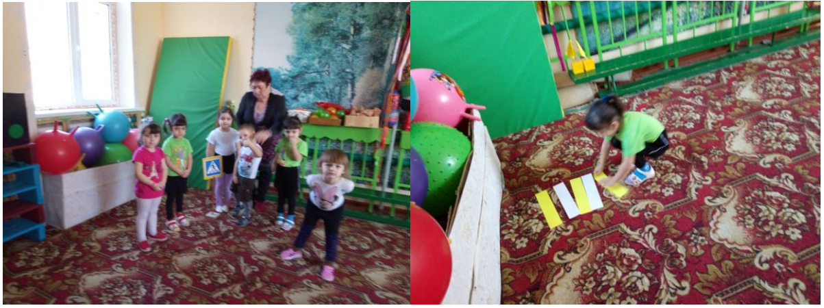
- Спортивный досуг по ПДД «Школа безопасности»