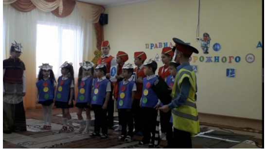
11.02.2019 г. Акция «Берегите наши сердечки» с участием команды ЮПИД