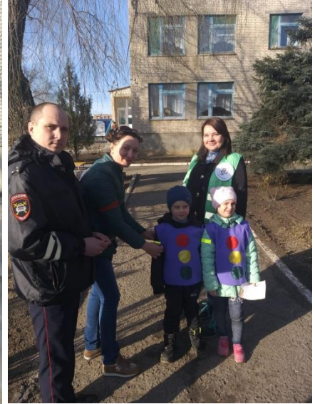
25.02. – 14.03.2019 г. Спортивные досуги по ПДД - «Красный, жёлтый, зелёный» - группа «Теремок»