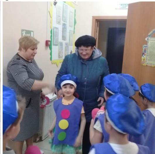
12.02.2019 г. Семинар – практикум «Ребенок. Дорога. Безопасность»