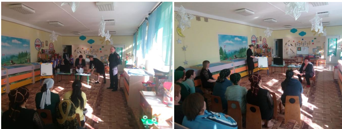
14.03.2019 г. Акция совместно с родительским патрулём «Засветись в темноте»