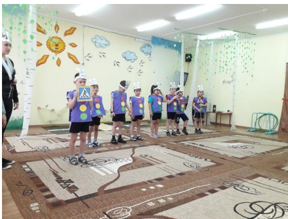
- Физкультурный досуг «В гостях у Светофора»